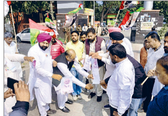
फतेहाबाद। लघु सचिवालय के बाहर पुतला फूंकते किसान।