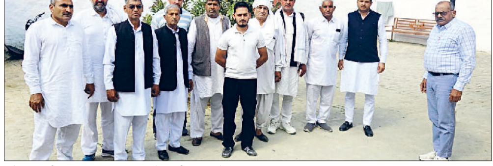
फतेहाबाद। सीआईए द्वारा तलब किए गए सोशल मीडिया फॉलोअर्स।