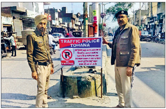
टोहाना। मेन मार्केट में नो पार्किंग का बोर्ड लगाते यातायात पुलिस कर्मचारी।

■ आपातकालीन वाहनों को भी मार्ग मिलने में कठिनाई आती थी