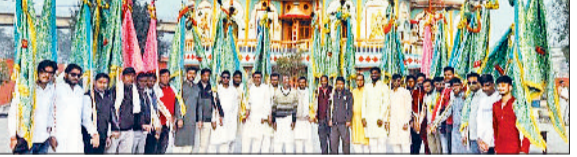
फतेहाबाद। पैदल निशान यात्रा में भाग लेते श्याम भक्त।