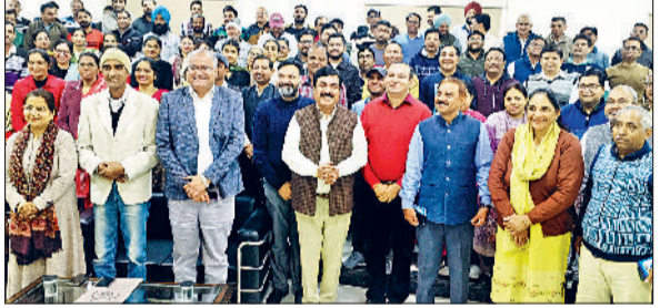
सिरसा। सीडीएनयू में दो दिवसीय प्रशिक्षण कार्यक्रम में उपस्थित शिक्षक।