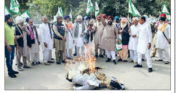
सिरसा। लघुसचिवालय में पुतले फूंकते किसान।