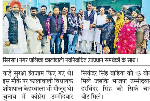
सिरसा। नगर पालिका कालावाली नवनिर्वाचित उपप्रधान समर्थकों के साथ।