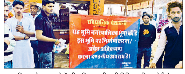
भूना। हिसार रोड पर करोड़ों की पालिका जमीन की डिजिटल निशानदेही के बाद नगर पालिका द्वारा लगाया गया चेतावनी बोर्ड और विराध में उतरे लोग।